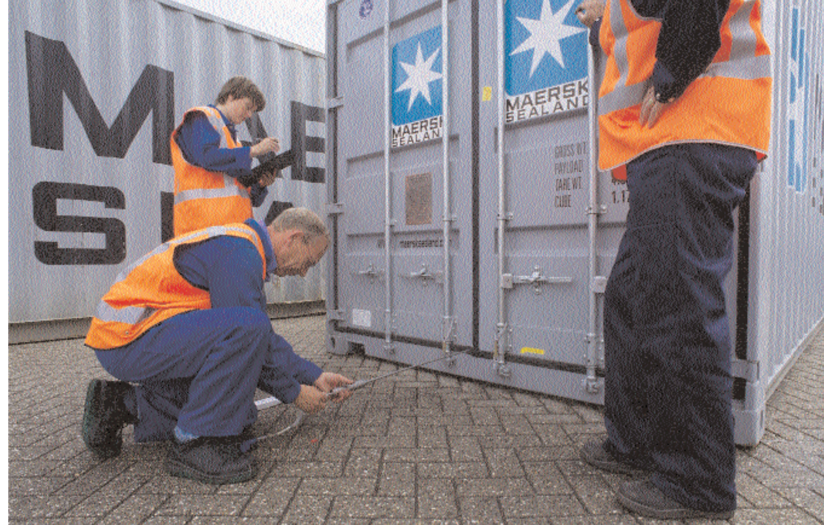
Medewerkers van VROM en RIVM meten of er gas in de containers is achtergebleven.

Tekst: Joost Swanborn